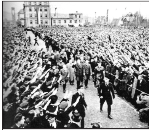
sudetští Němci zdraví své poslance

Soužití Čechů a Němců v československém státě označil Henlein, a ti, kteří s ním dopis koncipovali, už za nemožné. Problém měla „rozřešit“ Říše. Československu připsal dopis vinu za kdeco: bylo založeno jako antiněmecký stát, odboj vedený Masarykem a Benešem měl především proti německou tendenci, Československo žije v prostoru, který je