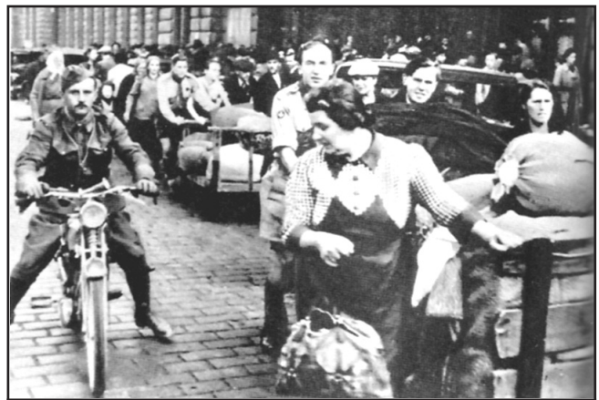
české obyvatelstvo vyhnané ze svých domovů v pohraničí